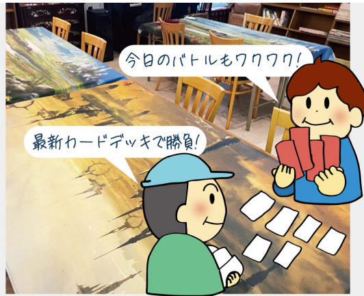
定期的なカードゲームのイベントを開催しているので環境設備もバッチリ! 詳しくは、お店のTwitterをチェック!