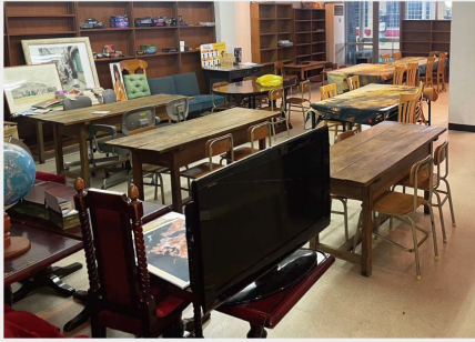
リノベーションされた2階スペース、自由に使える空間。