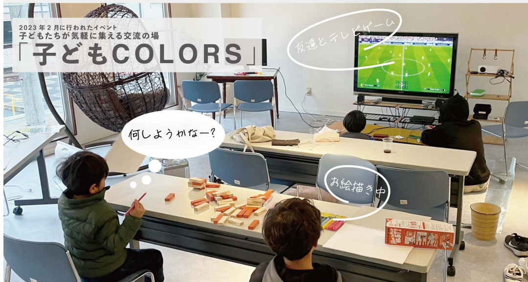
2023年2月に行われたイベント 子どもたちが気軽に集える交流の場