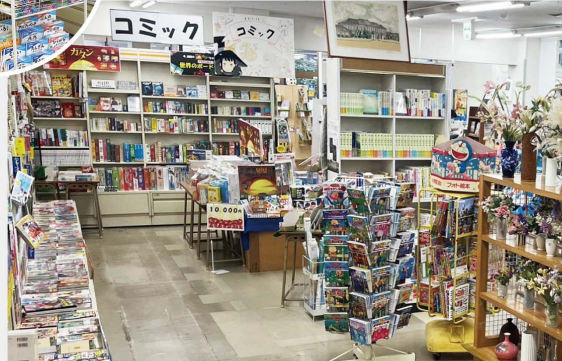
学習書から、小説、漫画、絵本、などなど様々な種類の本が揃っており子供から大人まで楽しめる