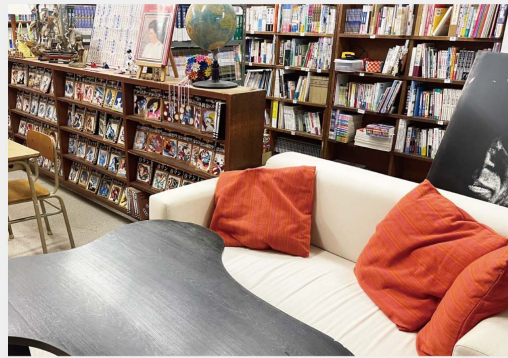
多様な使い方ができ、だれもが関わりたくなる場所づくりを目指しています。

元野木書店 福岡県飯塚市飯塚18-7 10:00 - 17:30 定休日:水曜 ☎0948-22-0048 Twitter @BooksMotonoki