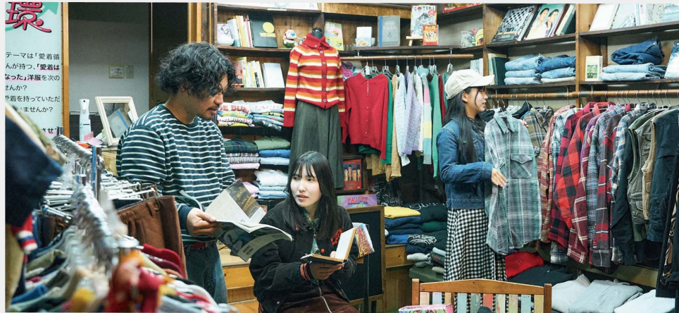
いつもと違う洋服、読んだことのないジャンルの本に出会える場所。