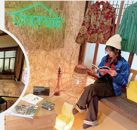
2階は読書や勉強、小さなイベントでもできるコミュニティスペース。和室+間接照明で落ち着いた雰囲気。